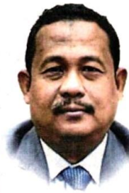
■ 阿末法兹里：市议会已提出申请，展延调涨门牌税。

他指出，市议会在发展巴生的过程中，总是会考虑到民意，并与各方合作，以实现继承巴生发展的目标，区内的民生问题也是市议会的优先事项。