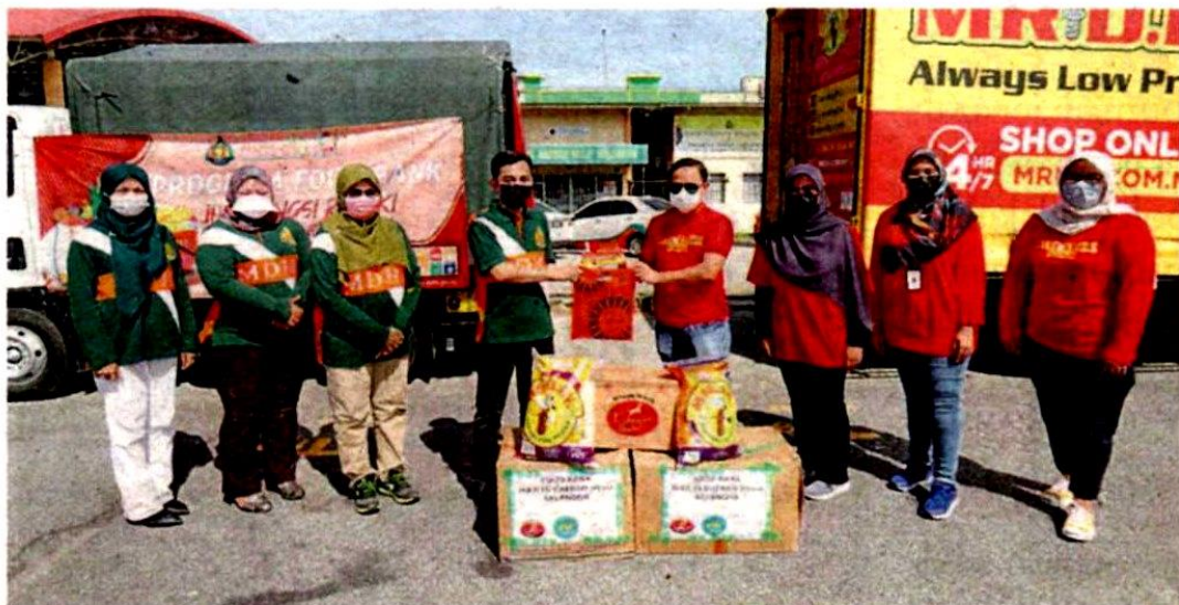
Kerjasama MDHS dan pihak swasta untuk membantu keluarga yang terjejas akibat Covid-19 menerusi program Food Bank Jom Kongsi Rezeki.

HULU SELANGOR - Majlis Daerah Hulu Selangor (MDHS) menjalinkan kerjasama strategik bersama beberapa pihak swasta menerusi program Food Bank Jom Kongsi Rezeki bagi membantu 171 keluarga memerlukan sekitar daerah ini susulan pandemik Covid-19.