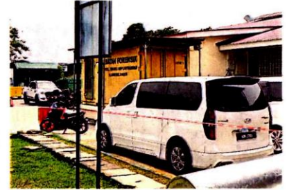
黄色货柜是巴生中央医院最早拥有的停尸货柜设施