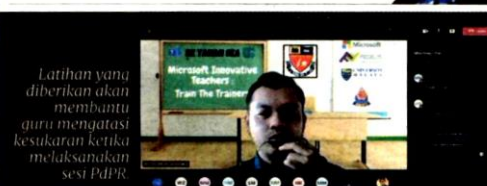
Latihan yang diberikan akan membantu guru mengatasi kesukaran ketika melaksanakan sesi PdPR.