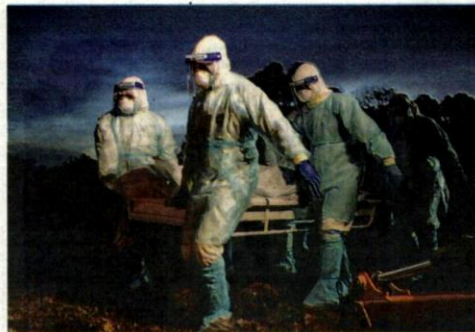
PEGAWAI Jabatan Agama Islam JAIS, Pegawai Kesihatan Daerah PKD Klang dan Pihak Pengurusan Jenazah Tanah Perkuburan Islam Selat Klang lengkap berpakaian PPE menguruskan pengebumian jenazah korban Covid-19 semalam.

Malah, dia juga tidak menyangka arwah bapanya yang dimasuk-