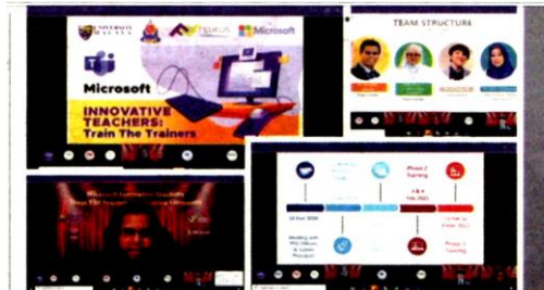
Program yang dianjurkan Universiti Malaya itu bagi memberi pendedahan kepada guru dengan teknologi terkini.