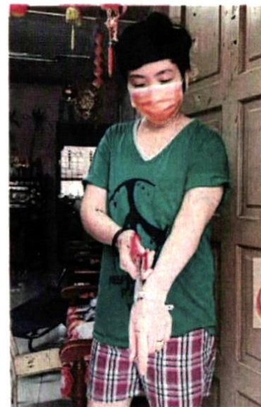
■得知强管令结束, 居民在官员监督下, 自行剪断隔离手环。

该组屋559名居民自该组屋从7月18日起, 实施为期14天的强化行动管制令 (EMCO), 原定本月31日结束, 惟随著899