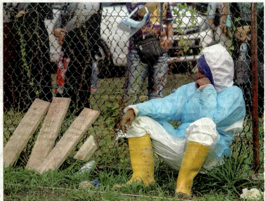
SEORANG kakitangan pengurusan jenazah di Tanah Perkuburan Islam Selat Klang di Klang keletihan selepas pengebumian jenazah mangsa Covid-19 kelmarin.

Menurutnya, pada Sabtu lalu, sebanyak 21 jenazah mangsa Covid-19 dibawa dari Jabatan Forensik, Hospital Tengku Ampuan Rahimah (HTAR), Klang dikebumikan di sini menjadikan jumlah keseluruhan jenazah yang dikebumikan sejak pelaksanaan program pengurusan jenazah berpusat meningkat kepada 120 jenazah.