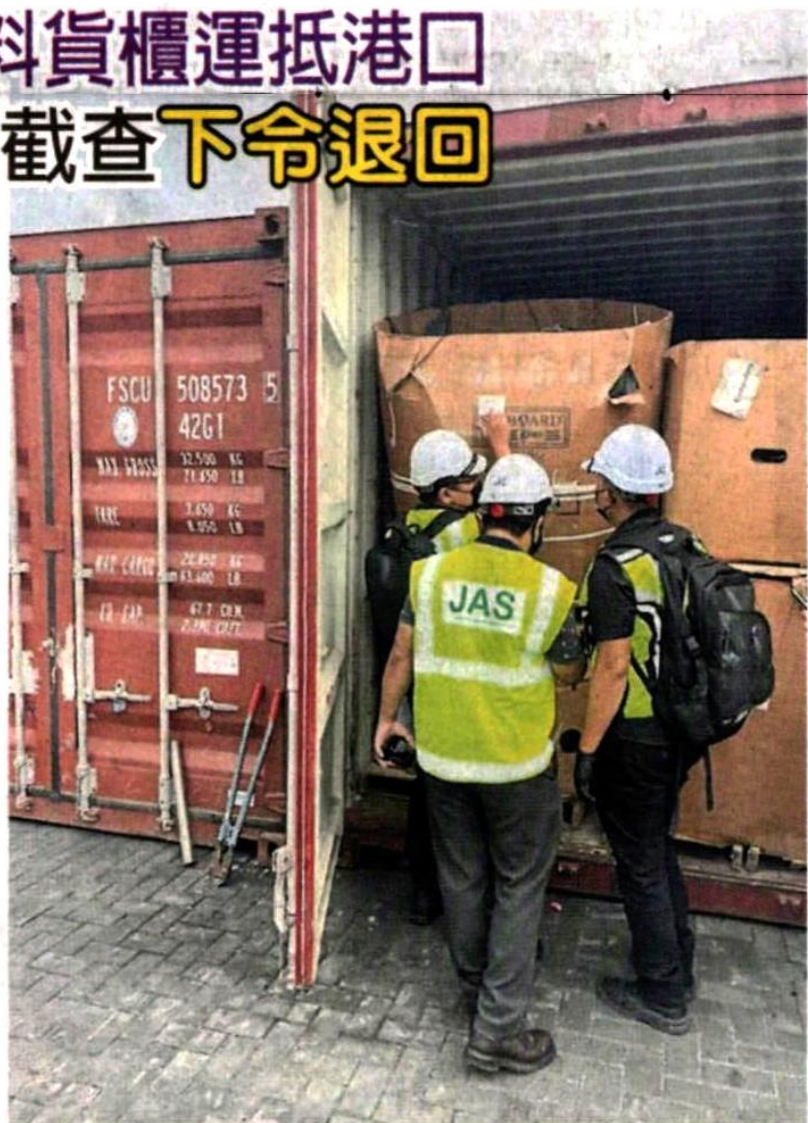
■雪州环境局截查2个装有电子废料的货柜。

从今年1月至7月，雪州环境局已下令将90个货柜，装有1750公吨，价值631万令吉的电子废料退回原产国，该局致力于打击跨境的环境犯罪，防止雪州沦为外国倾倒废物的地点。